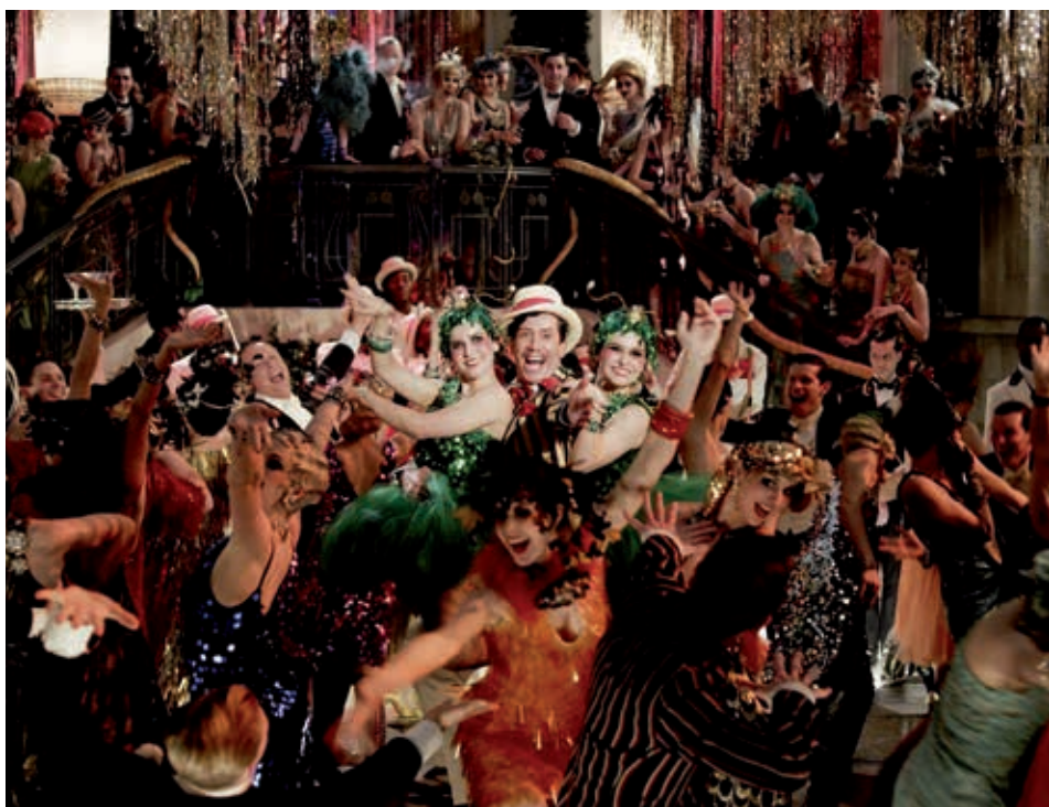
↑ Wat waren de jaren twintig: feesten om de kater van de oorlog weg te werken of hoop op een nieuw begin? Scène uit een recente verfilming van The Great Gatsby (2013) door Baz Luhrmann.

van de 20ste eeuw de ‘eeuw van Amerika’ zou maken. Hij begint zijn verhaal midden in de Eerste Wereldoorlog, in 1916. Op dat moment was de Amerikaanse politiek nog niet officieel betrokken in de oorlog, maar op de achtergrond waren Amerikaanse financiers al onmisbaar. Het zou niet lang meer duren voordat de Verenigde Staten zich ook militair in de strijd zouden mengen. Met veel tegenzin trouwens, want president Woodrow Wilson was herkozen met de toezegging dat hij de neutraliteitspolitiek van de Verenigde Staten zou handhaven. Wilson zag veel liever een ‘vrede zonder overwinning’, waarna Amerika als morele scheidsrechter het wereldleiderschap op zich zouden kunnen nemen. Maar doordat de Duitsers besloten tot een onbeperkte duik-