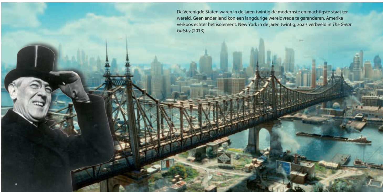
De Verenigde Staten waren in de jaren twintig de modernste en machtigste staat ter wereld. Geen ander land kon een langdurige wereldvrede te garanderen. Amerika verkoos echter het isolement. New York in de jaren twintig, zoals verbeeld in The Great Gatsby (2013).

↑ Woodrow Wilson, president van de Verenigde Staten (1913-1921) en instigator van een Pax Americana die echter niet van de grond kwam.